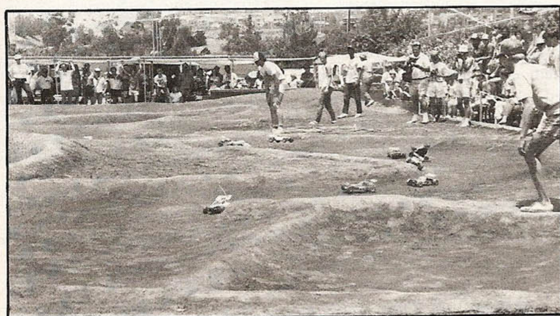
Ein Teil der WM-Strecke in Del Mar.